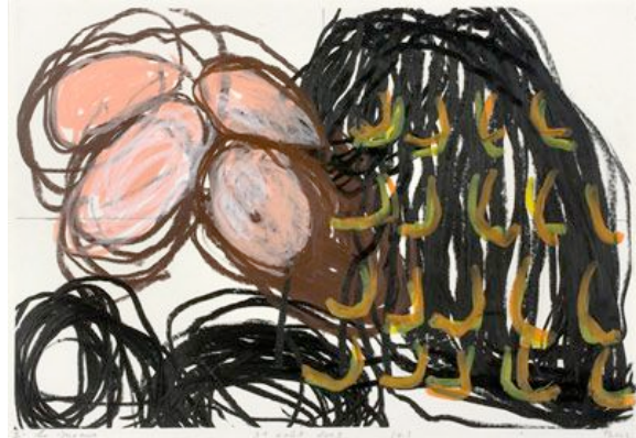
La bête noire de la phénoménologie, 2009, pastel à la cire sur papier, 50 x 70 cm

Cette expression parfois violente et inquiète trouve presque naturellement sa source dans la confrontation avec d'autres cultures occidentales, souvent anciennes, plus particulièrement dans l'éblouissement hispanique, de même qu'elle transcrit les épreuves traversées, pour s'ouvrir avec les « stèles » récentes sur un espace plus apaisé.