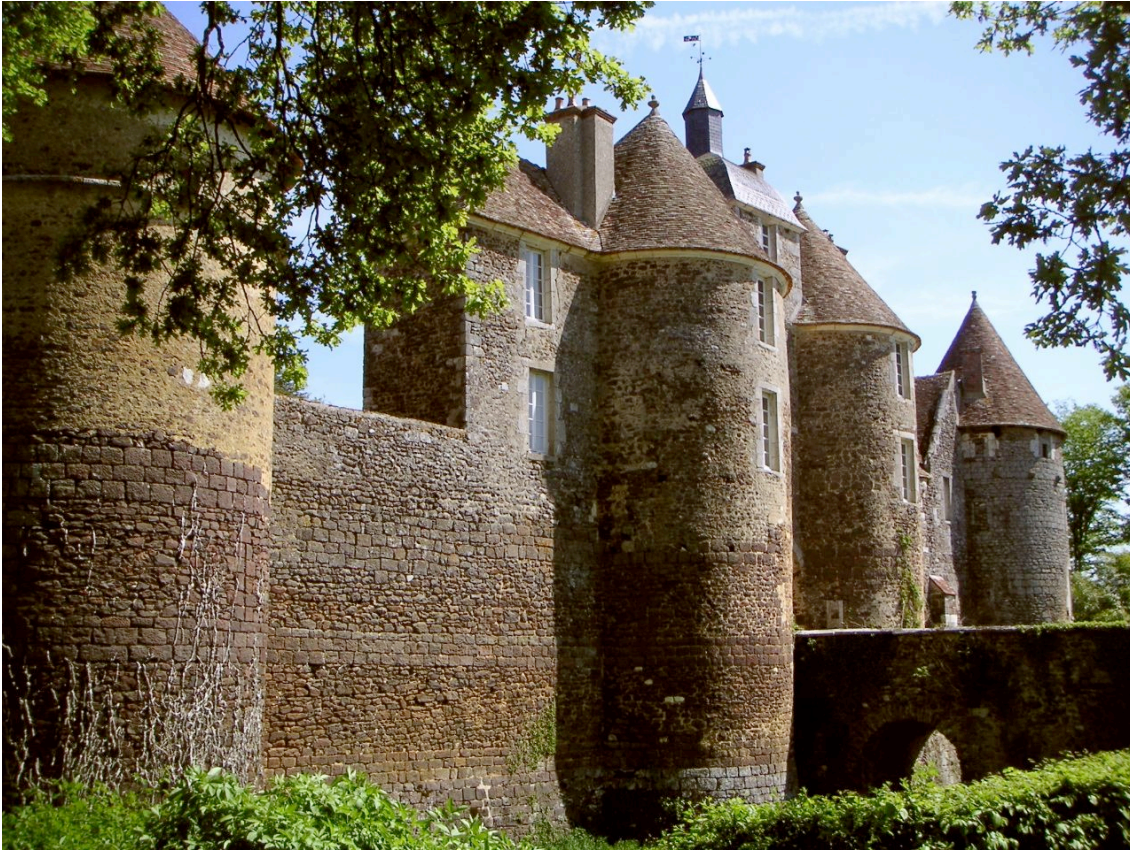
Château de Ratilly XIIIe siècle – Centre d'art vivant

L'exposition est ouverte tous les jours du 18 juin au 30 septembre 2011 de 10h à 18 heures