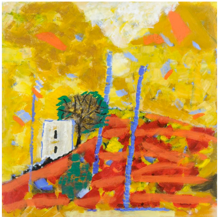
Ah ! Les beaux jours, 2011, acrylique sur toile, 130 x 130 cm

Louttre. B (Paris, 1926) peintre, graveur et sculpteur, présente des compositions dont la figuration allusive est un soutien à la richesse des couleurs qui dialoguent avec les paysages du Lot. François Mathey en a parfaitement résumé le sens : « Louttre est de ceux qui éprouvent une jubilation singulière à se raconter avec des formes simples et la simple couleur. Pas d'esthétique astucieuse ni de métaphysique déplacée mais des images peintes qui font saliver le regard car elles ont le goût de la terre chaude, du ciel après la pluie, une tendresse émue pour les choses quotidiennes ».